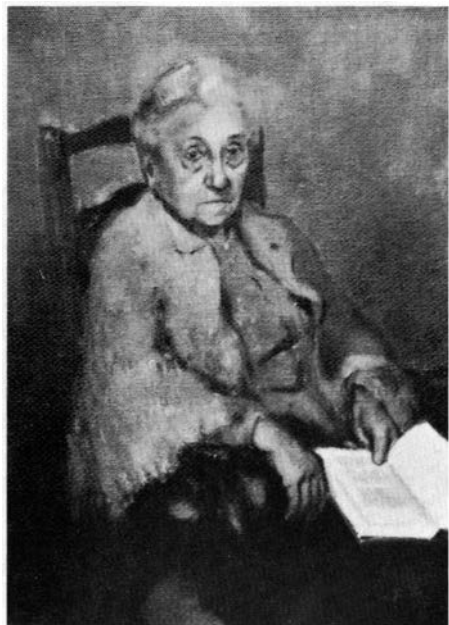
La mare de l'artista, 1957.